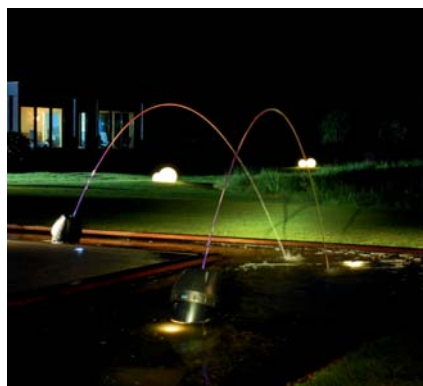
Schwerpunkt Themen: u.a. Golfterrasse