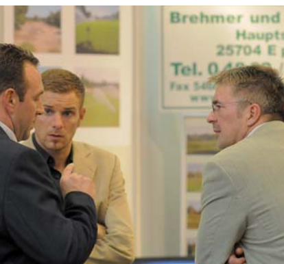
Business to Dialog